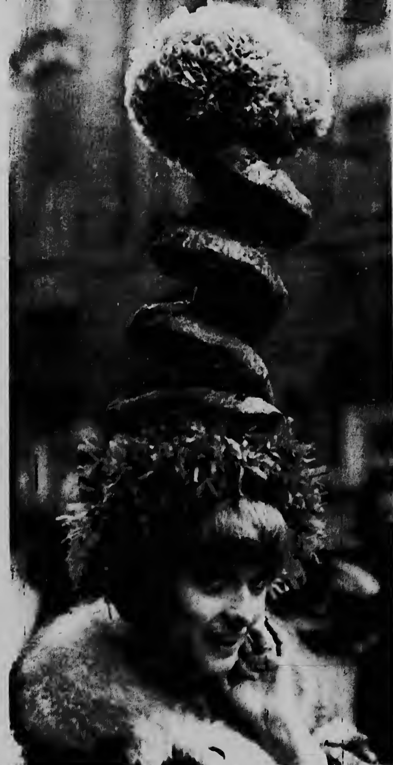
E peinada aki ta ser yamá "Embruhador di Colebra", pero cu si un colebra lo ser impresiona, nos ta duda. Di tur manera nan a laga e modelo aki competi den un concurso pa e peinado mas loco y mas elegante. E contest a ser organisá door di.....estudiantenan